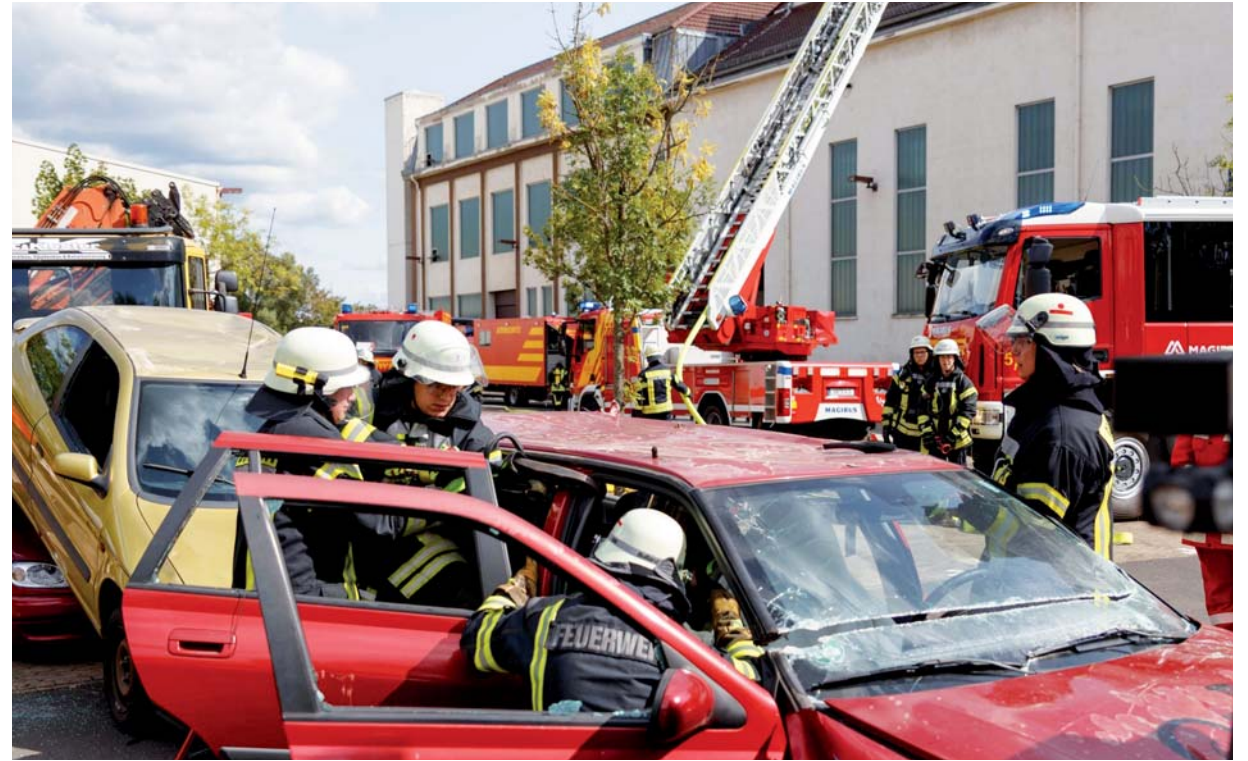
Völklinger Feuerwehrmänner proben die Befreiung von schwerstverletzten Insassen eines PKW's

dass es während Wartungsarbeiten zu einer Verpuffung kam, aus der sich ein Feuer im Wohngebäude und der angrenzenden Halle entwickelte. Drei Personen waren verletzt und mussten von der Feuerwehr gerettet werden. Dazu gingen zwei Trupps unter schwerem Atemschutz in den Keller des dreigeschossigen Gebäudes vor und brachten zwei Personen nach draußen. Eine Person machte sich gleich bei Ankunft des ersten Feuerwehrfahrzeugs am Fenster im zweiten Obergeschoss bemerkbar, welche dann über die vierteilige Steckleiter gerettet wurde. Da absehbar war, dass größere Mengen Löschwasser benötigt werden, hat die Feuerwehr dieses aus der rund 200 Meter entfernten Saar entnommen und zur Übungsstelle befördert. Währenddessen wurde nach weiteren Personen gesucht, die Gebäude mittels Überdrucklüfter rauchfrei gemacht und das Feuer, teilweise über die Drehleiter, bekämpft. Aufgrund der starken Rauchentwicklung und dem hohen Aufkommen an Einsatzkräften haben Schaulustige, unter anderem während der Fahrt, dieses Ereignis gefilmt. Dabei kam es zu einem Unfall, bei dem fünf Fahrzeuge einander aufgefahren sind. Ein Lkw